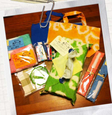
Towel, Coaster, Bag!!!